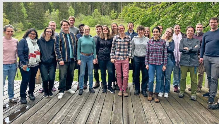
Die zweite Ausgabe des IfGG Symposiums stand im Zeichen der Doktorierenden und Postdocs.

Zeigen Schwankungen im Durchmesser von Bäumen die Schwere von Dürreschäden an? Wo in Europa liegen Potentiale für Rewilding? Wie hängen Blattstickstoff und Stickstoffverfügbarkeit in nährstoffarmen Böden zusammen? Diese und weitere Fragen aus den Forschungsgebieten des Instituts für Geographie und Geoökologie (IfGG) des KIT wurden auf dem zweiten IfGG-IFU Symposium diskutiert, das am 2. und 3. Mai 2024 in Garmisch-Partenkirchen stattfand. Gastgeberinnen waren die Arbeitsgruppen des IMKIFU am KIT-Campus Alpin, der durch eine beeindruckende Alpenkulisse mit Waxenstein und Alpispitze besticht. Diese gemeinsamen Symposia sind wertvolle Gelegenheiten für Vernetzung und Austausch. Neben interessanten Vorträgen und engagierten Diskussionen umfasste das Programm auch eine Führung durch die Forschungsinfrastruktur am KIT-Campus Alpin, wo die Forschenden in Laboren und Gewächshäusern ihre Experimente durchführen. Die dritte Ausgabe des Symposiums soll im Aueninstitut Rastatt stattfinden. ■