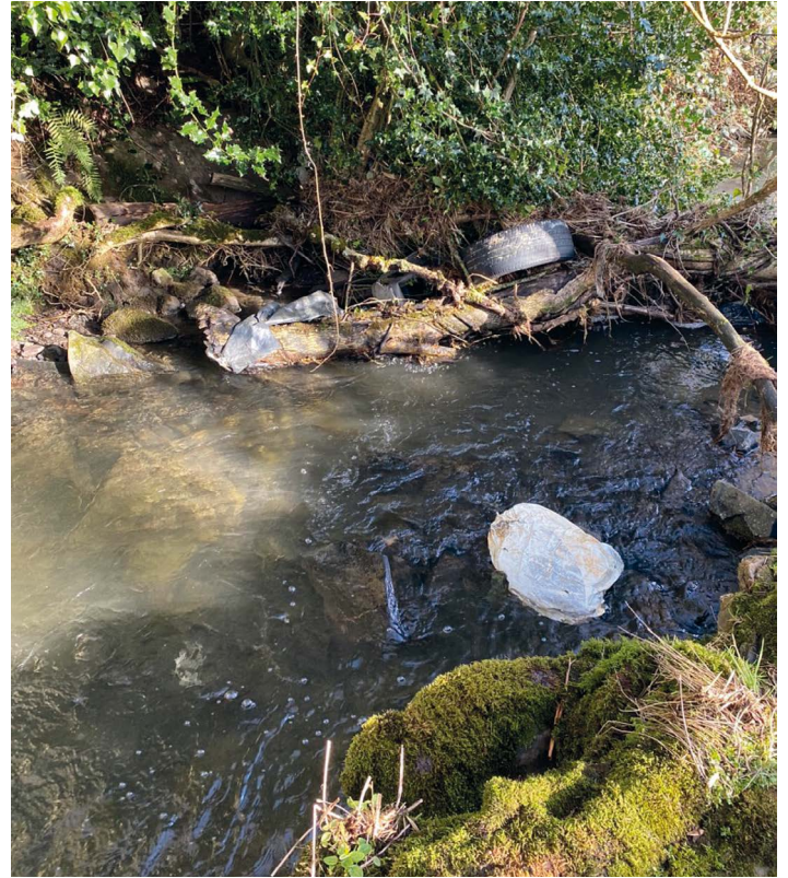
Plastikmüll verunreinigt nicht nur Meere, sondern auch Flüsse und Bäche.