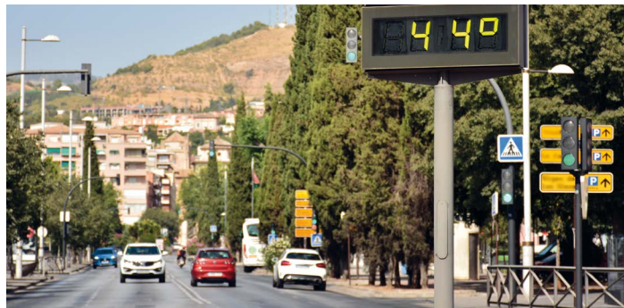
Hitzewellen kosten Leben - meist unbemerkt.