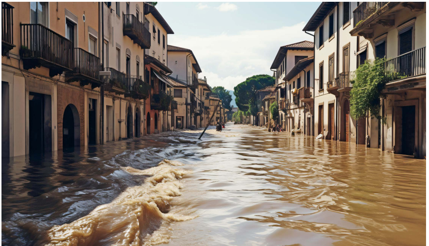
Überschwemmungen in der Emilia Romagna 2023.

Originalpublikation: Precursors and pathways: Dynamically informed extreme event forecasting demonstrated on the historic Emilia-Romagna 2023 flood