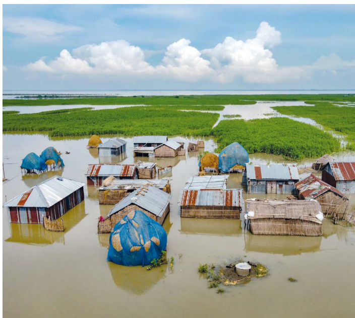
Klimakatastrophe: Kosten, die ganze Volkswirtschaften ruinieren können.

Durch diesen Ansatz könnte die Resilienz der betroffenen Volkswirtschaften gestärkt werden – die betroffenen Länder können sich dann besser gegen die zunehmenden klimatischen Herausforderungen wappnen. Die Ergebnisse ihrer Studie haben die Forschenden bei der UN-Klimakonferenz 2023 (COP28) in Dubai präsentiert. „Sie können einen wichtigen Beitrag zur globalen Klimapolitik leisten“, so Daniell. ■