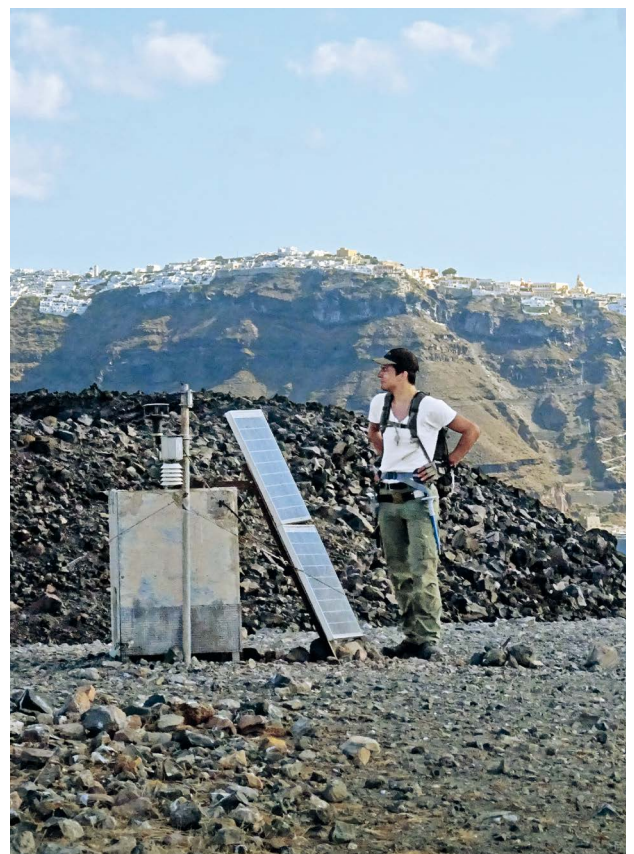
Die Messstation auf Nea Kameni mit Santorini im Hintergrund.