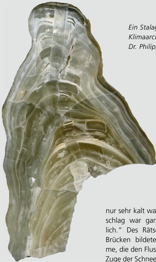
Ein Stalagmit als Klimaarchiv.

deuten auf Veränderungen im Wasserhaushalt und beim Kohlenstoff in der Vegetation hin.