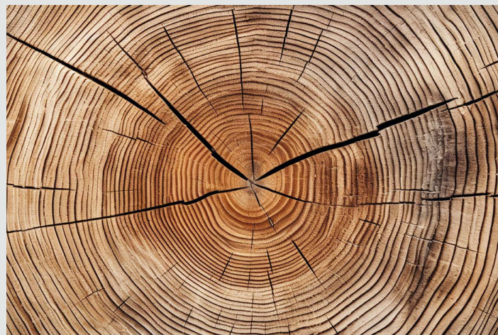
Baumscheiben dokumentieren nur das Wetter im Sommer – Tropfsteine zeichnen das Geschehen ganzjährig auf.