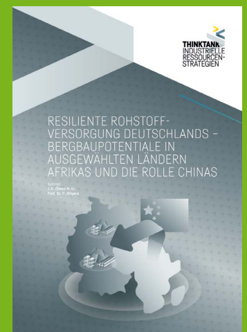
Titelseite der Broschüre „Resiliente Rohstoffe“.

Weitere Infos unter: www.thinktank-irs.de