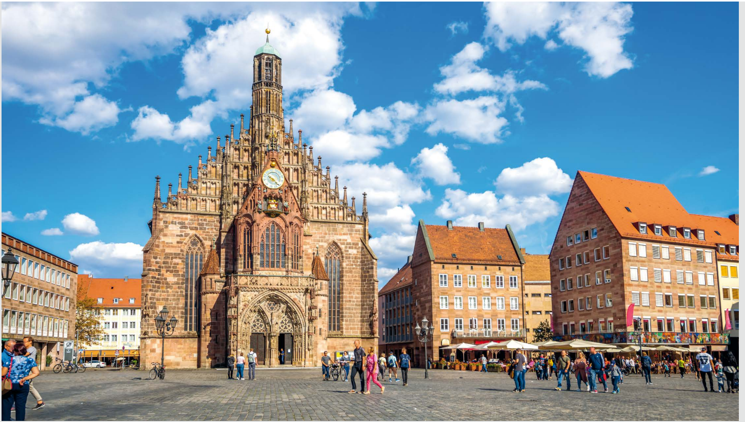
Nürnberg – seine Stadtgeschichte, dendrologische Auswertungen und die Untersuchung eines Stalagmiten liefern Erkenntnisse über das Klima vergangener Jahrhunderte.